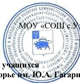
График питания учащихся в столовой МОУ «СОШ с. Узморье им. Ю.А. Гагарина»