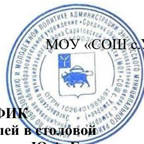
ГРАФИК дежурства учителей в столовой МОУ «СОШ с. Узморье им. Ю.А. Гагарина»