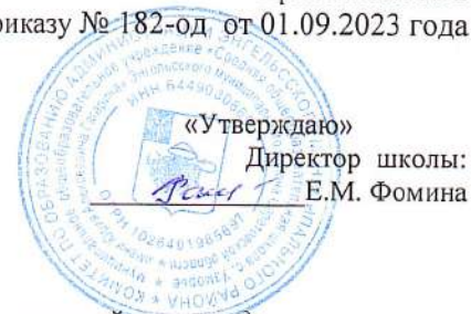
График посещения школьной столовой комиссией по контролю за организацией питания обучающихся (родительский контроль) в МОУ «СОШ с.Узморье им. Ю.А. Гагарина» в период с 01.09.2023 по 31.05.2024